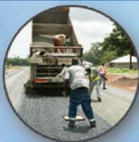
Aménagement de chaussées