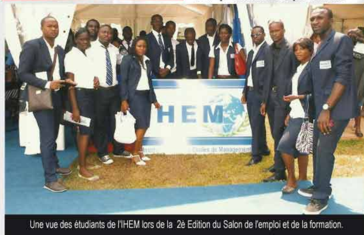
Une vue des étudiants de l'IHEM lors de la 2è Edition du Salon de l'emploi et de la formation.

autant que de sens et de significations symboliques. C'est l'intérêt de la formation pour les entreprises. Et la gestion des ressources humaines doit répondre au mieux aux besoins de l'entreprise en personnel. Ces besoins sont à la fois quantitatifs et qualitatifs.