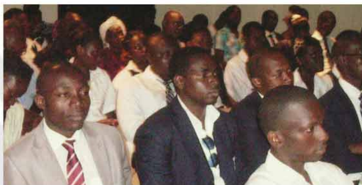
Une vue des participants à la conférence sur "Emploi, développement et croissance" vendredi, 24 mai 2013 à l'Institut français de développement 2è Edition du Salon de l'emploi et de la formation.

En effet, s'il est vrai qu'il n'y a de richesse que d'hommes, il est tout aussi évident de faire observer que le développement est appréhendé comme un processus de libération et d'autocréation de production de richesses matérielles