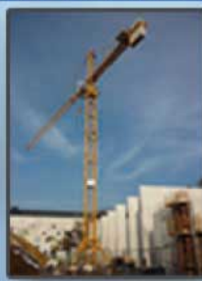
Grue & Bétonnière de chantier